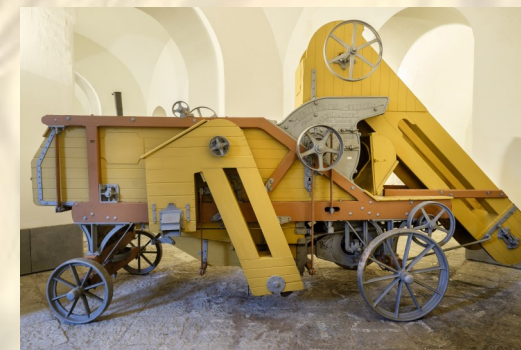
Sfogliatrice-Sgranatrice per mais (1899) - Centro MUSA, Portici (NA)

CEREALI E SCIENZA: resilienza, sostenibilità e innovazione